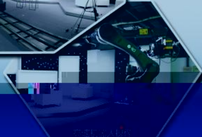
工业机器人培训室